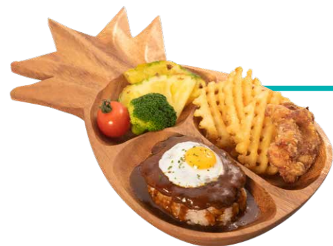
キッズプレート/ロコモコ