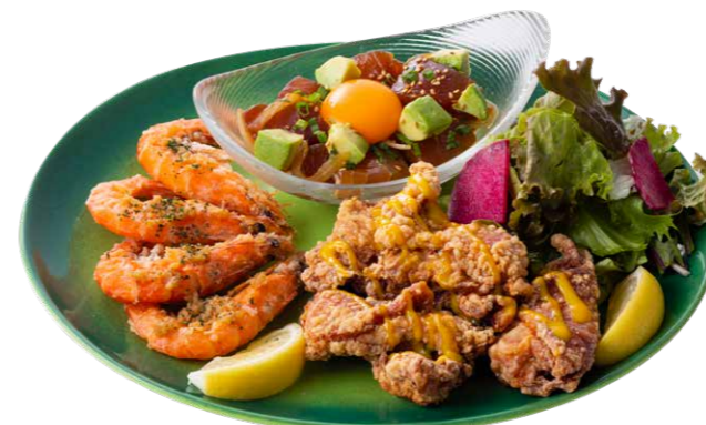
ハワイアンロングボード