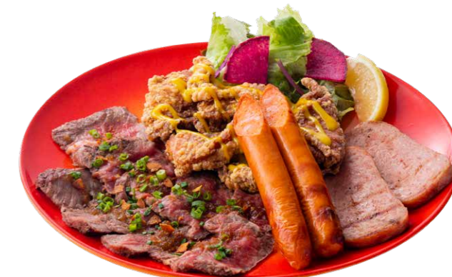
アイランドミートロングボード