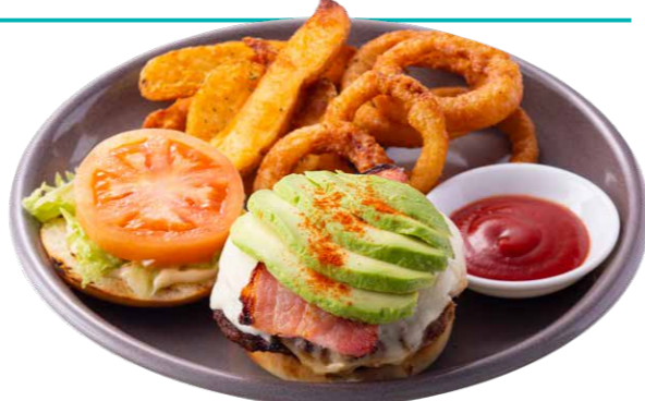
ブリックハウスバーガープレート