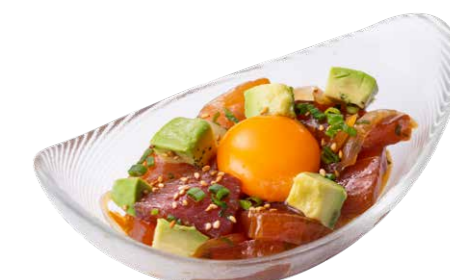
マグロとアボカドのポキ