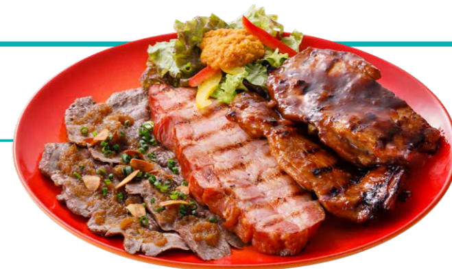
ラバロックグリルロングボード