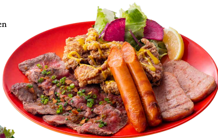
アイランドミートロングボード