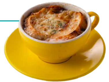
オニオングラタンスープ