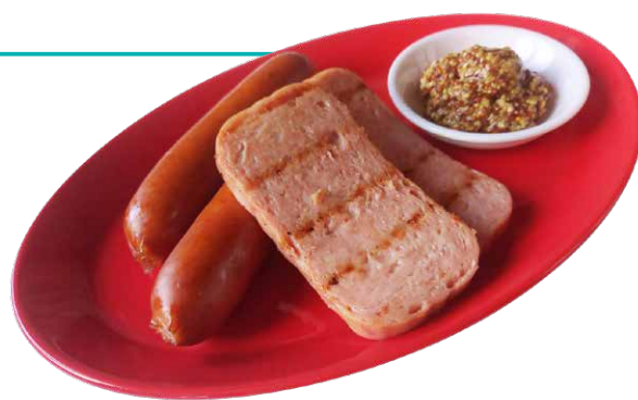
ソーセージとスパムのグリル