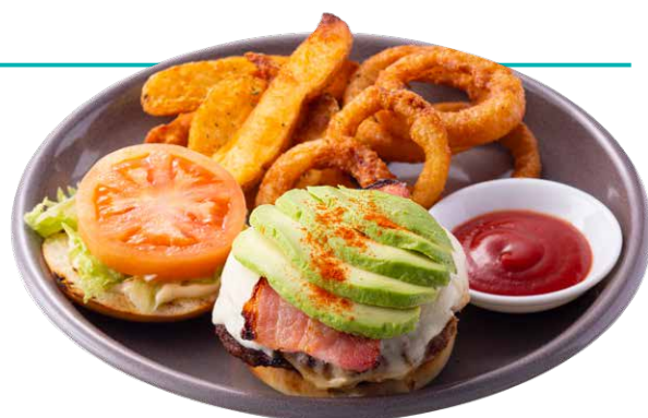
ブリックハウスバーガープレート

モッツァレラチーズを溶かしたパティに バジルソースを合わせベーコンとアボカドをトッピングした スペシャルバーガー。