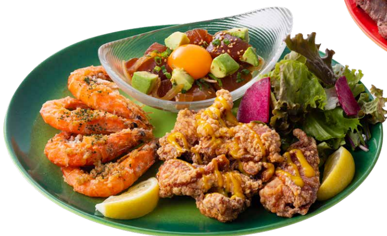
ハワイアンロングボード