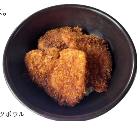
ソースカツボウル