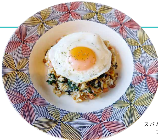
スパムとホウレンソウの フライドライス