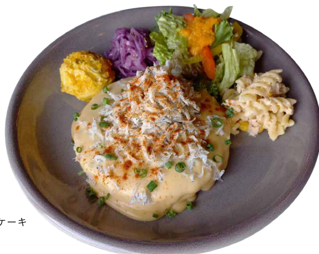
シラスパンケーキ

大葉を散らし和風チーズソースを流し たっぷりのしらすを載せたごちそうパンケーキ。