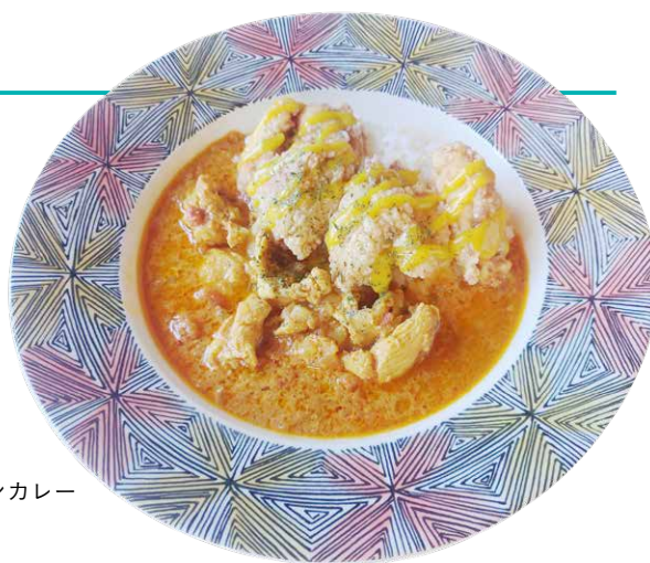
ダブルチキンカレー