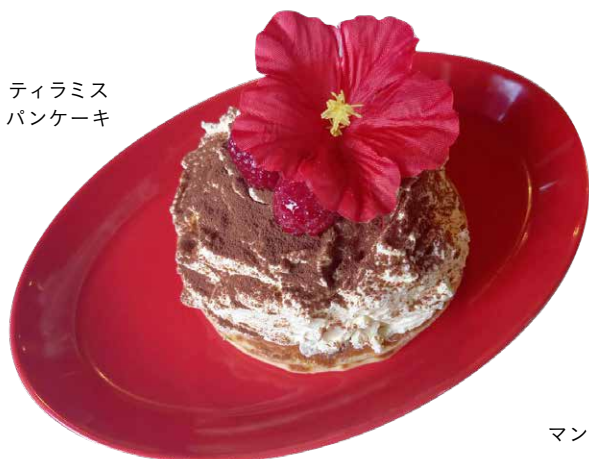
ティラミス パンケーキ