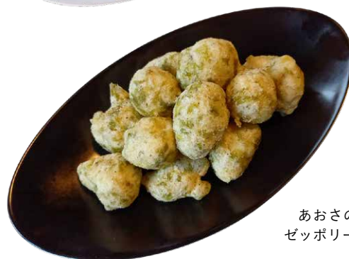
あおさの ゼッポリーネ