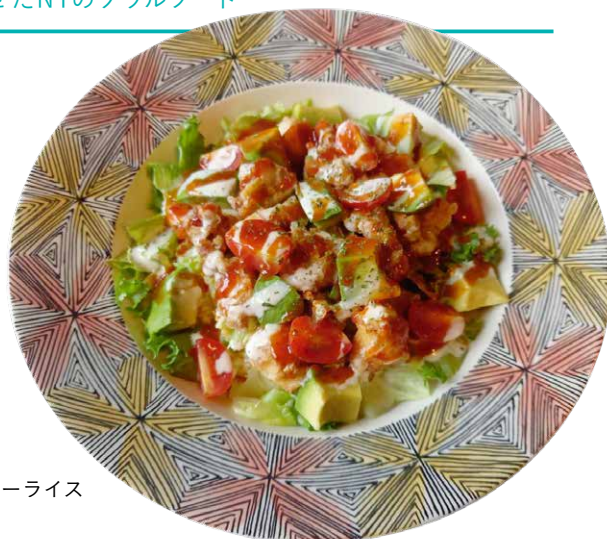
チキンオーバーライス

カレーピラフにモチコチキンとトマトとアボカドのサラダを載せてチーズソースとチリソースで仕上げたブリックハウス風チキンオーバーライス。