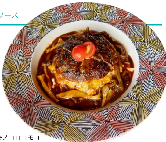
オムキノコロコモコ

TOPPING/+100yen ▶ ベーコン / アボカド / チェダーチーズ / モッツァレラチーズ