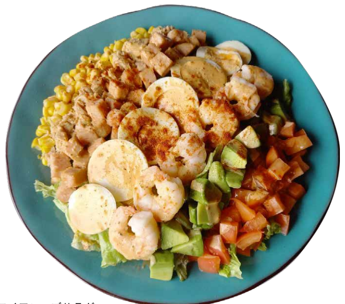
ハワイアンコブサラダ