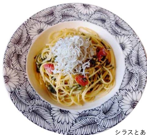
シラスとあおさの ペペロンチーノ