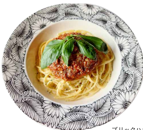
ブリックハウス風 ボロネーゼ