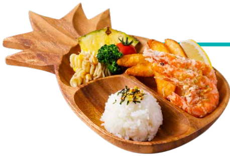
キッズプレート/ガーリックシュリンプ