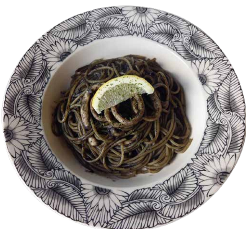
イカ墨スパゲッティ