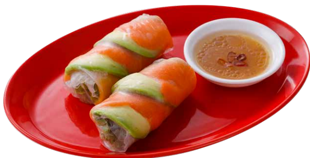
サーモンとアボカドの生春巻き