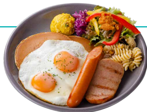
ハワイアンブレックファーストA