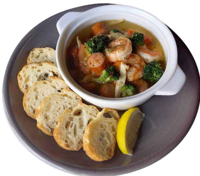
ブリックハウス風アヒージョ