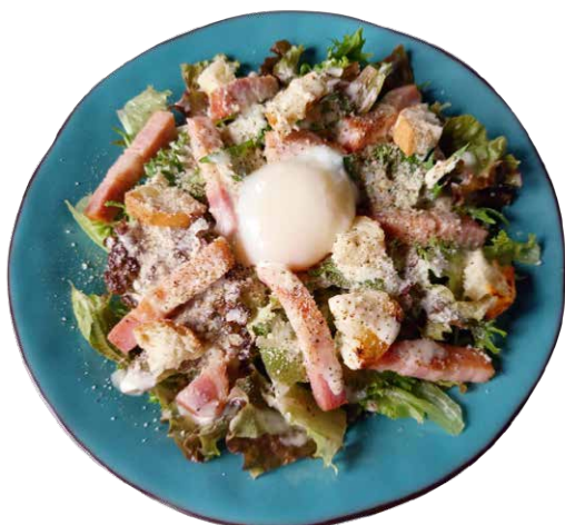
炙りベーコンと温泉卵のシーザーサラダ