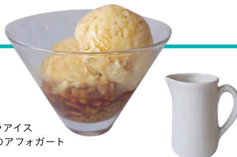
バニラアイス アロハ醤油のアフオガード