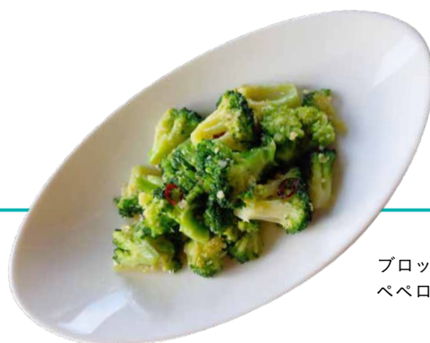
ブロッコリーの ペペロンチーノ