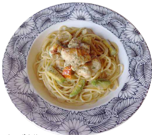
チキンとアボカドの バジルクリーム